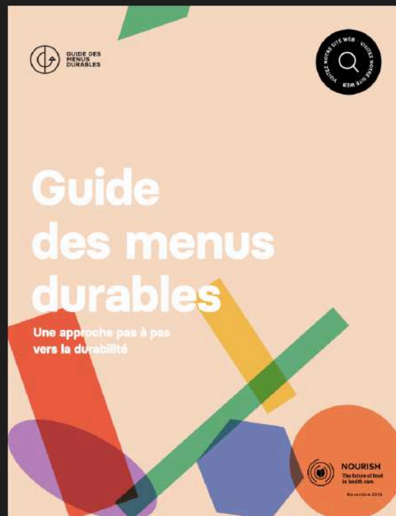
Guide des menus durables Nourrir la santé

Les protéines végétales sont diverses et polyvalentes. Elles peuvent être utilisées en entrée, en plat ou en dessert. Le rapport EAT Lancet les décrit comme un pilier du menu de santé planétaire, lui-même essentiel pour assurer un système alimentaire sain, juste et écologique. D'ailleurs, ce menu est compatible avec de nombreuses cultures, traditions et préférences individuelles. 1