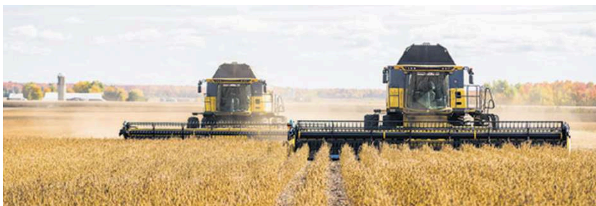
Agriculteurs et propriétaires de terres de soya (St-Isidore-de-Laprairie)

Depuis maintenant plus de 39 ans , nous perfectionnons notre art pour offrir le meilleur produit sans OGM et sans gras trans. Nos maîtres du tofu broient le soya avec de l'eau pour en obtenir une boisson qui est ensuite transformée en tofu en ajoutant un coagulant.